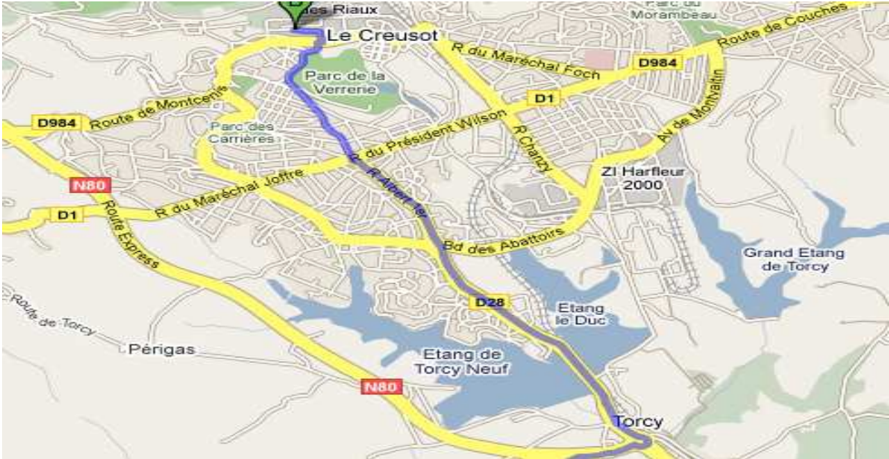
Plan d'accès de l'hôtel LE PRE AU BOIS (point A)