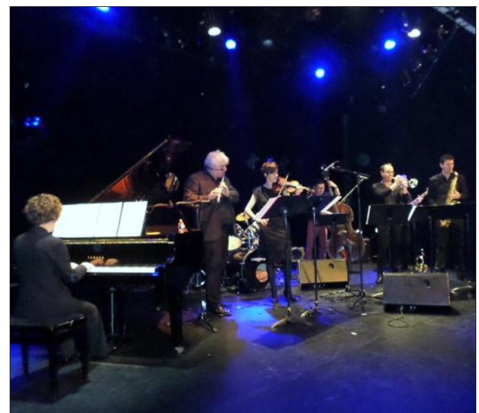
■ Un concert de qualité.